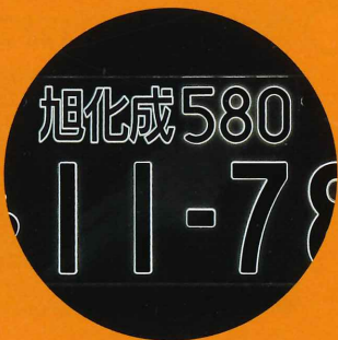
夜間点灯イメージ